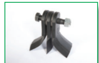
2 Coltelli a Y + 1 diritto (optional) Y shaped blades with straight blade (optional) 2 Couteaux □ Y + 1 droit (optional) 2 Y-Messer und 1 gerades Messer (optional)