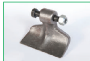
Mazza liscia (di serie) Flat hammer (standard) Masse lisse (de série) Glattschlegel (standard)